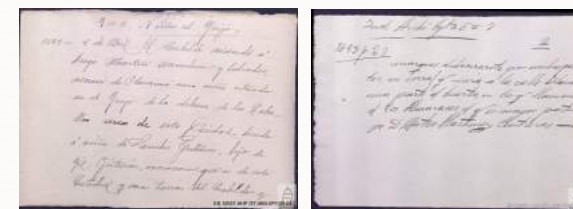
ES.10037.AHP./27.58//LVP/95:33 y 129:4

En la colección se conserva un conjunto de fichas descriptivas que sirven para resumir y registrar los datos extraídos de los documentos existentes en los archivos municipal y capitular de la ciudad de Plasencia durante el siglo XIX. La fecha de los documentos originales descritos abarcan desde 1100 a 1825.