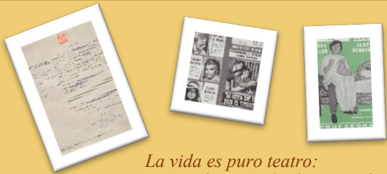
La vida es puro teatro: Autorizaciones de espectáculos teatrales

Bajo el título “La vida es puro teatro”, arrancamos con una de las actividades culturales y artísticas más antiguas que se conocen, y que tienen lugar sobre un escenario en el que se representan historias diversas a través de actores en una puesta en escena. Para ello, daremos a conocer varios documentos, que se conservan en este archivo, relacionados con diferentes aspectos pero que tienen como temática común el teatro, los cuales se irán mostrando en tres exposiciones diferenciadas.