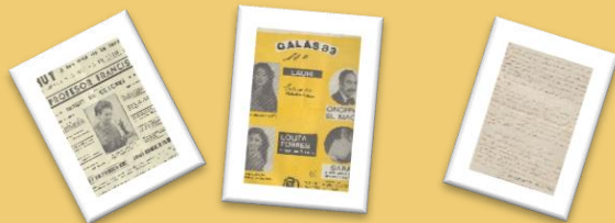
ABRACADABRA La magia en el Archivo

Bajo el título “Abracadabra: La magia en el Archivo”, continuamos nuestro recorrido por los espectáculos de ocio y cultura. Ahora le toca el turno a los espectáculos que son capaces de engañar a nuestra mente, de mezclar la realidad con actos contrarios a las leyes naturales, de embelesar a niños y mayores. Para ello, daremos a conocer varios documentos, que se conservan en este archivo.