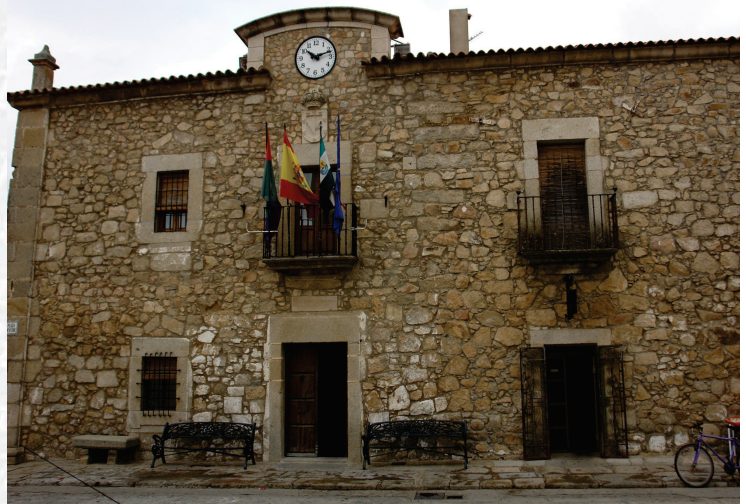
Ayuntamiento de Zarza la Mayor