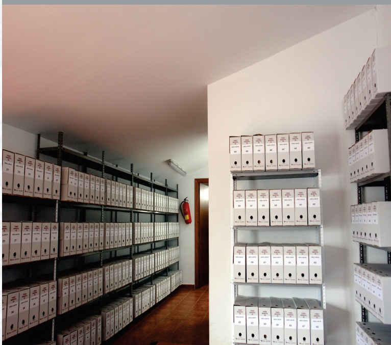
Archivo Municipal de Zarza la Mayor después de la elaboración del inventario.