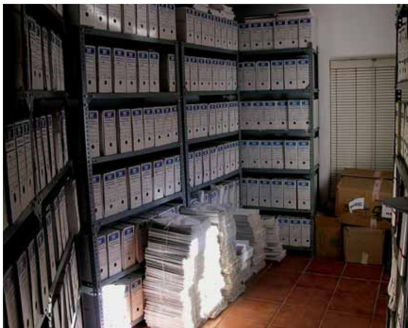
Archivo Municipal de Trasierra antes de elaborar el Inventario.