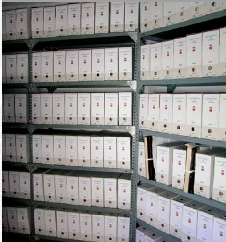
Archivo Municipal de Trasierra después de la elaboración del Inventario.