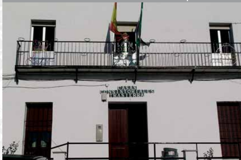
Fachada del Ayuntamiento.