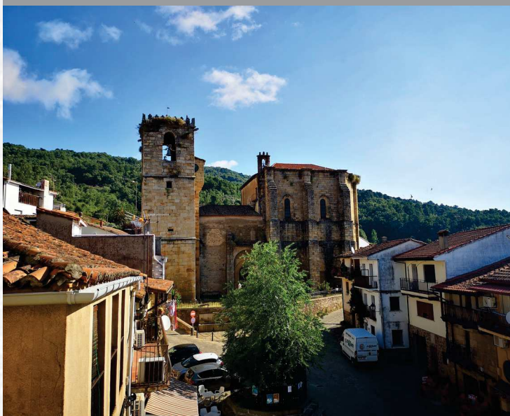
Torre de Don Miguel

STREMADURA Por Lopez año de 1700. Fuera, por el ucia, y por el Occidente con sien- ncia del Reyno de Portugal. nte a dia, 62. leguas, y Norte por lo mas ancho tertilidad esta Pro- Rios Tago, y Guadiana, viesan por enmedio, y chicas, que son el diomon- y el stradilla & Badajoz lia, Capital de la Provin- Obispado, y un Puente sobre diano, edificado por los llaza de Guerra, y tiene Castillos, el uno del O rejal, y del otro lado erro esta el fuerte de S. Merida, y en esta Angu- nto tiempo hizo de la antigua situada sobre el Rio Guadiana.