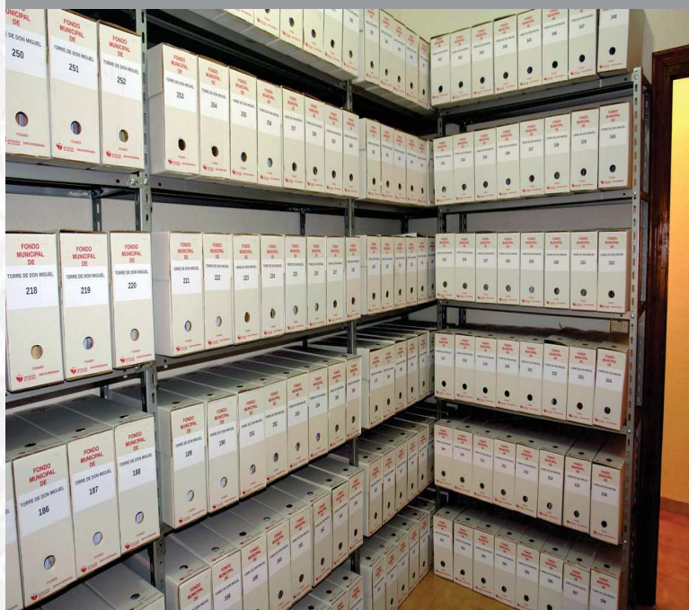
Archivo Municipal de Torre de Don Miguel después de la elaboración del inventario.