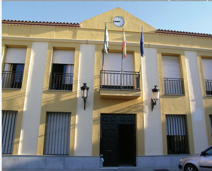
Ayuntamiento de Talavera la Real

ESTREMADURA Por Lopez año de 1700. y por Fuera, por el ucia, y por el Occidente con sien- incia del Reyno de Portugal. nte a sus 62. leguas, y Norte por lo mas ancho tertilidad esta Pro- Rios Tago, y Guadiana, viesan por en medio, y chicas, que son el demon- y el straitta & Badajoz la, Capital de la Provin- Obispado, y un Puente sobre dima, edificada por los llaza de guerra, y tiene Castillos, el uno del regal, y del otro lado erro esta el fuerte de S. Merida, llamada Angu- bro tiempo libez de la antigua situada sobre el Rio Guadiana.