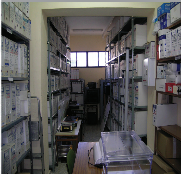
Archivo Municipal de Talavera la Real antes de la elaboración del inventario.