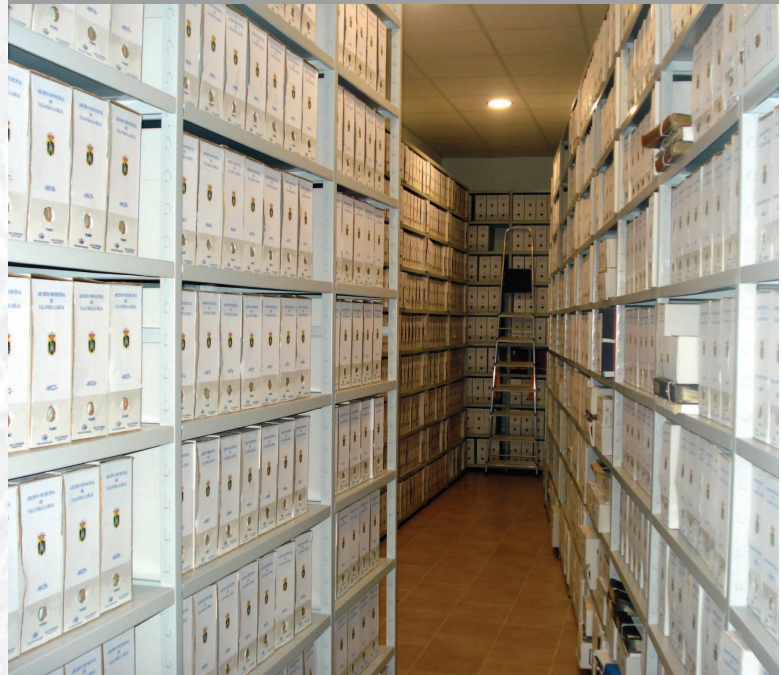
Archivo Municipal de Talavera la Real después de la elaboración del inventario.