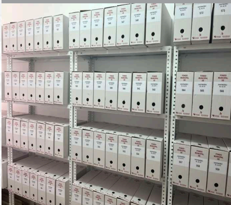
Archivo Municipal de Santibáñez el Alto después de la elaboración del inventario.