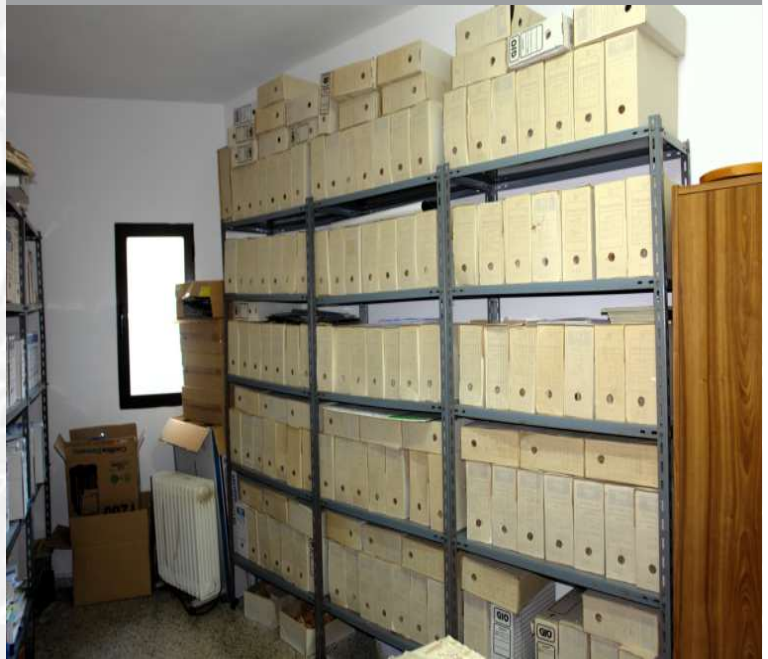
Archivo Municipal de Santibáñez el Alto antes de la elaboración del Inventario.

STREMADURA Por Lopez año de 1700. Fija, por el ucia, y por el Occidente ncia del Reyno de Portugal arte a Suroeste, laguas, y Norte por lo mas ancho entulizaci en esta Pra- Rios Tago, y Guadiana, viesan por enmedio, y chicos, que son el demon- y el aridilla & Badajoz sa, Capital de la Provin- Obispado, y un Puente sobre diana, edificado por los llana de guerra y tiene Castillos, el uno del litoral, y del otro lado erro esta el fuerte de S. Merida la uerita Augu- nto tiempo la obra de la antigua tural la sobre el Rio Guadiana.