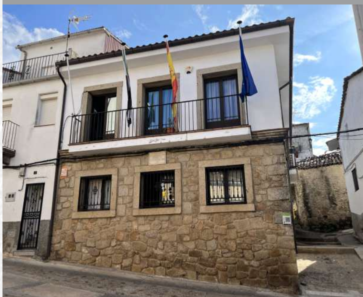
Ayuntamiento de Santibáñez el Alto

STREMADURA Por Lopez año de 1700. Fija, por el ucia, y por el Occidente con ajen- incia del Reyno de Portugal. rte a sus b.2. aguas, y Oeste por lo mas ancho entulza en esta Pro- Rios Tago, y Guadiana, viesan por enmedio, y chicos, que son el donon- y el stridilla & Badajoz la, Capital de la Provin- Obispado, y un Puente sobre diana, edificado por los lla a de guerra, y tiene Castillos, el uno del rte, y del otro lado erro es la el fuerte de S. Merida, y merida Angu- nto tiempo laboza de la antigua tural la sobre el Rio Guadiana.