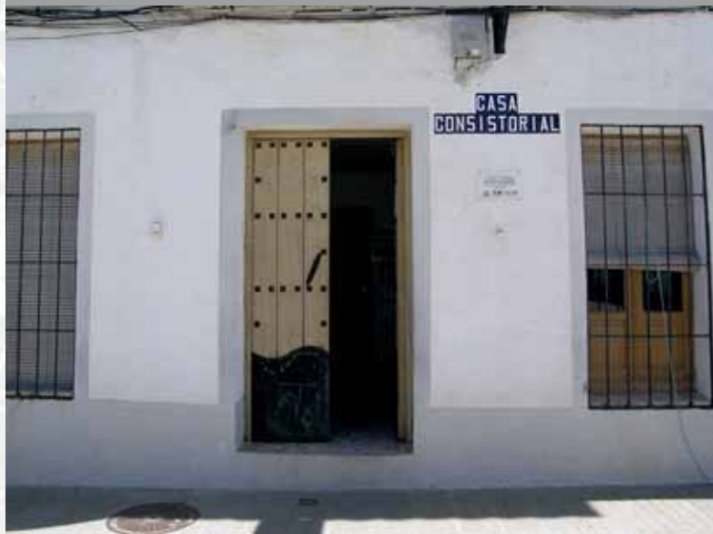
Fachada del Ayuntamiento de Retamal de Llerena.