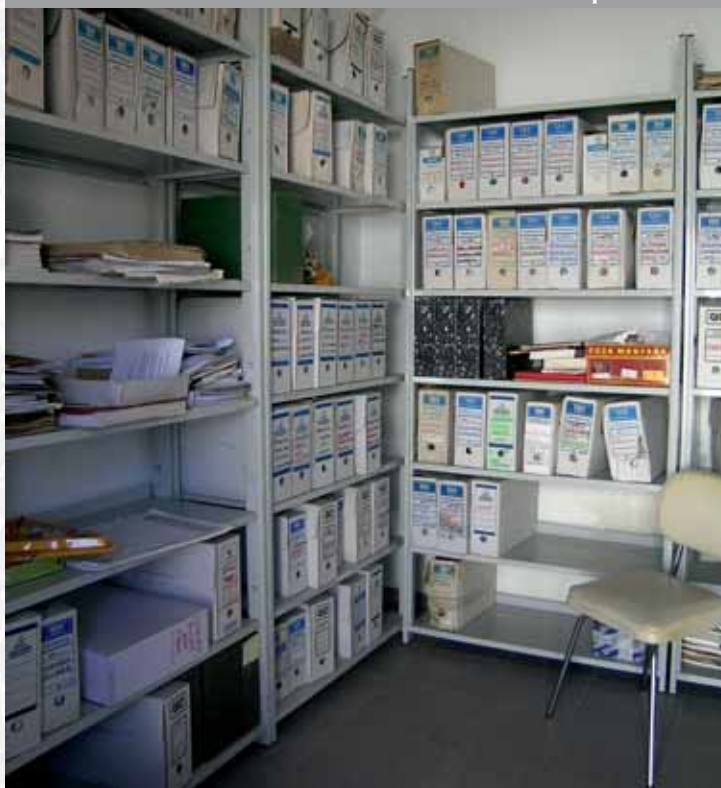
Archivo Municipal de Retamal de Llerena antes de elaborar el inventario.