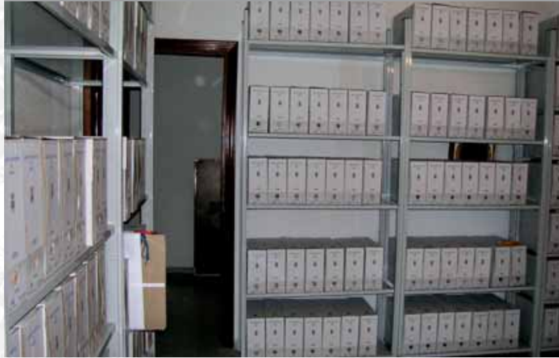
Archivo Municipal de Reina después de la elaboración del Inventario.