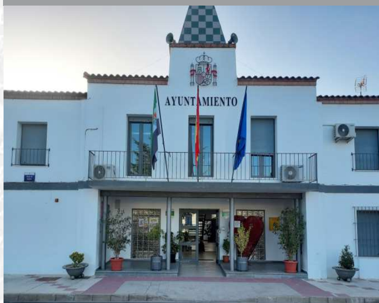
Ayuntamiento de Puebla de Alcollarín