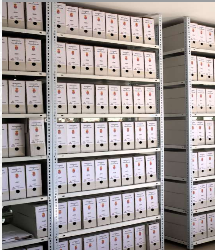
Archivo Municipal de Puebla de Alcollarín después de la elaboración del inventario.