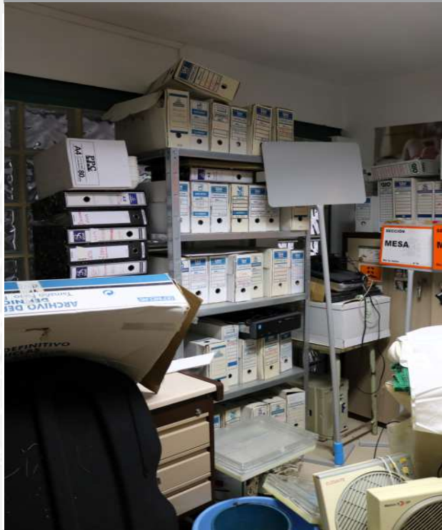
Archivo Municipal de Puebla de Alcollarín de la elaboración del Inventario.