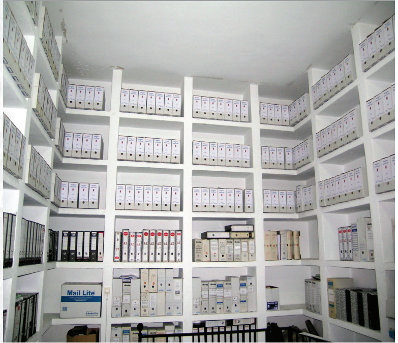
Archivo Municipal de Medina de las Torres después de la elaboración del inventario.