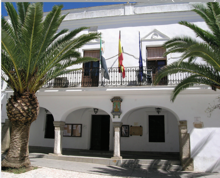
Ayuntamiento de Medina de las Torres

ESTREMADURA Por Lopez año de 1700. y pa Fuera, por el ucia, y por el Occidente con Allen- incia del Reyno de Portugal. nte a dia, 62. leguas, y Norte por lo mas ancho tertilidad esta Pro- Rios Tago, y Guadiana, viesan por en medio, y chicas, que son el demon- y el straitta & Badajoz lia, Capital de la Provin- Obispado, y un Puente sobre dima, edificada por los llaza de guerra, y tiene Castillos, el uno del O regal, y del otro lado erro esta el fuerte de S. Merida venerata Angu- bro tiempo libeza de la antigua situada sobre el Rio Guadiana.