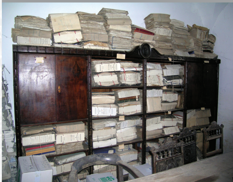
Archivo Municipal de Medina de las Torres antes de la elaboración del Inventario.