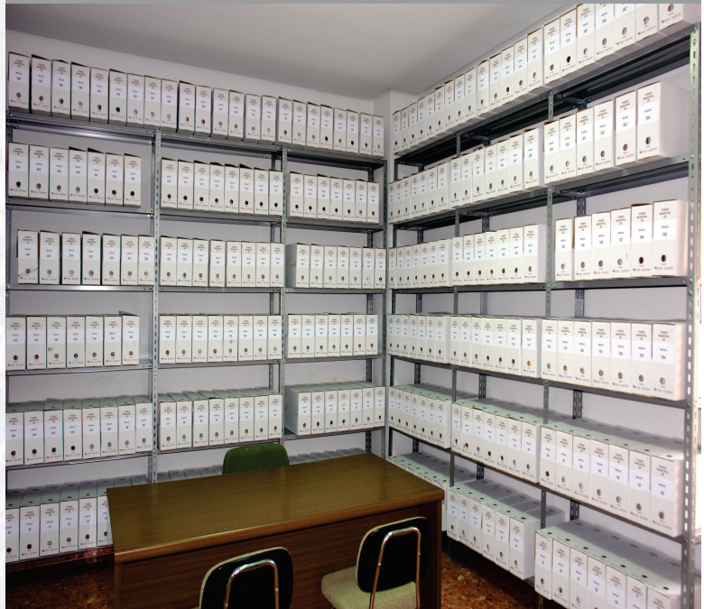
Archivo Municipal de Brozas después de la elaboración del inventario.