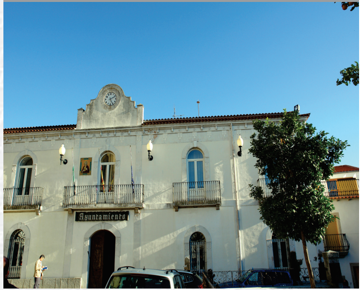
Ayuntamiento de Brozas

STREMADURA Por Lopez año de 1700. y pa Fuera, por el ucia, y por el Occidente con alien- encia del Reyrio de Portugal. nte a sus 62 leguas, y Norte por lo mas ancho tertilidad esta Pro- Rios Tago, y Guadiana, viesan por en medio, y chicas, que son el dionon- y el stradilla & Badajoz la, Capital de la Provin- Obispado, y un Puente sobre dima, edificado por los llaza de guerra, y tiene Castillos, el uno del regal, y del otro lado erro es la el fuerte de S. Merida, y en esta Angu- bro tiempo libeza de la antigua situada sobre el Rio Guadiana.