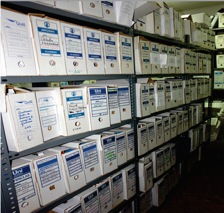
Archivo Municipal de Brozas antes de la elaboración del Inventario.

STREMADURA Por Lopez año de 1700. Fueja, por el ucia, y por el Occident incia del Reyno de Port nte a sus 62. leguas y Verte por lo mas ancho tertiles en esta Pro- Rios Tago, y Guadiana, viesan por enmedio, y chicas, que son el di non y el straitta & Badajoz lia, Capital de la Provin- Obispado, y en Puente sobre dima, edificada por los llaza de guerra y tiene Castillos, el uno del regal, y del otro lado erro esta el fuerte de S. Merida lanerata Augu- bro tiempo libeza de la antigua situada en el Rio Guadiana.