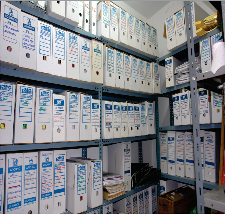
Archivo Municipal de Portaje antes de la elaboración del Inventario.