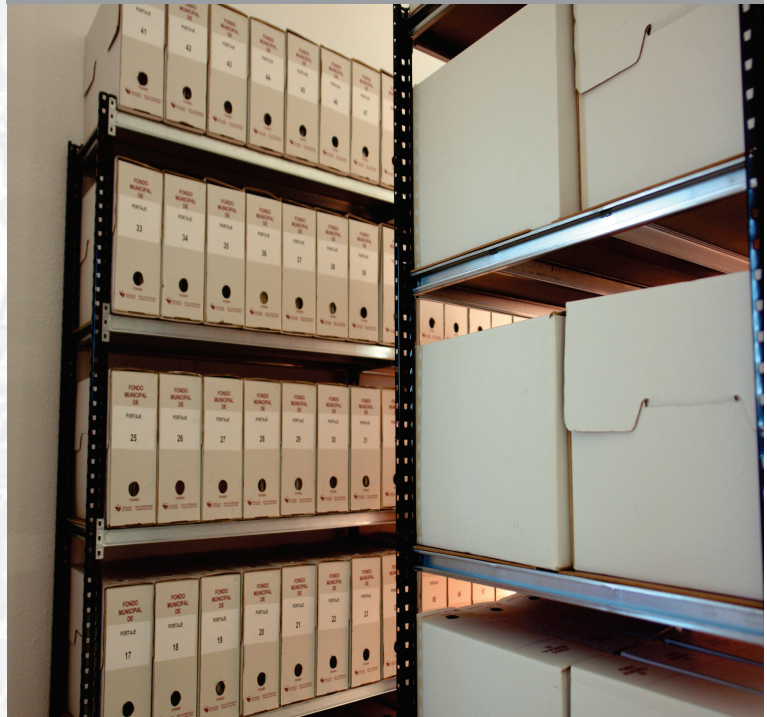
Archivo Municipal de Portaje después de la elaboración del Inventario.