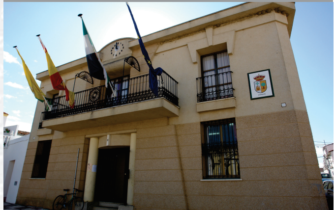
Archivo Municipal de Portaje

ESTREMADURA Por Lopez año de 1700. y parte de la Fuera, por el Medio-dia ucia, y por el Occidente con Allen- incia del Regno de Portugal. nte a San, 52. leguas, y Norte por lo mas ancho tertilidad esta Pro- Rios Tago, y Guadiana, viesan por en medio, y chicos, que son el Guadiana y el Aradilla & Badajoz sa, Capital de la Provin- Obispado, y un Puente sobre diana, edificado por los Plaza de Guerra y tiene Castillos, el uno del Portugal, y del otro lado erry esta el fuerte de S. Merida y en esta Angu- nto tiempo libreza de la antigua situada la sobre el Rio Guadiana.