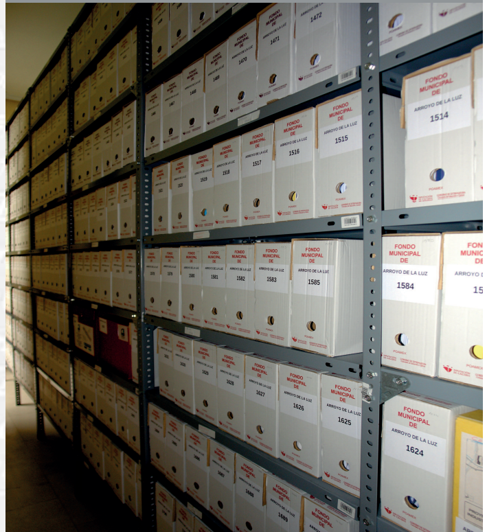
Archivo Municipal de Arroyo de la Luz después de la elaboración del Inventario.