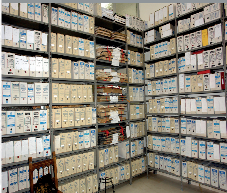
Archivo Municipal de Arroyo de la Luz antes de la elaboración del Inventario.