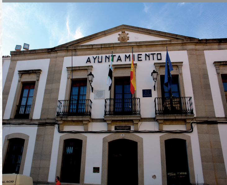
Ayuntamiento de Arroyo de la Luz

STREMADURA Por Lopez año de 1700. y pa Fuera, por el ucia, y por el Occidente con sien- incia del Reyno de Portugal. nte a sus 62 leguas, y Norte por lo mas ancho tertilidad esta Pro- Rios Tago, y Guadiana, viesan por enmedio, y chicas, que son el diomon- y el stradilla & Badajoz la, Capital de la Provin- Obispado, y un Puente sobre diano, edificado por los llaza de Guerra, y tiene Castillos, el uno del rejal, y del otro lado erro esta el fuerte de S. Merida, y en esta Angu- nto tiempo libre de la antigua situa