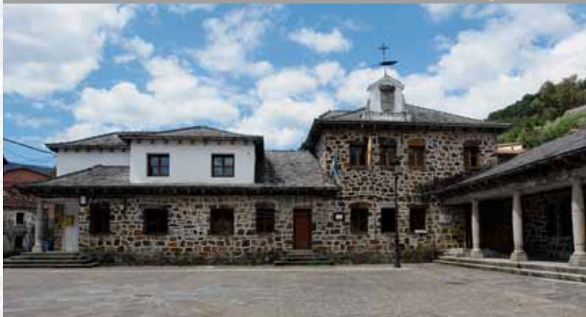
Ayuntamiento de Nuñomoral.