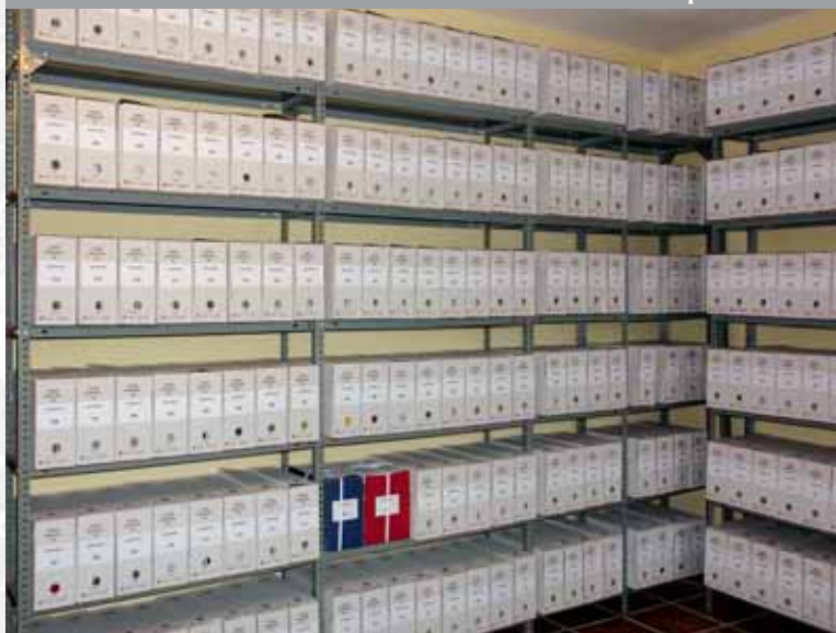
Archivo Municipal de Nuñomoral después de la elaboración del Inventario.