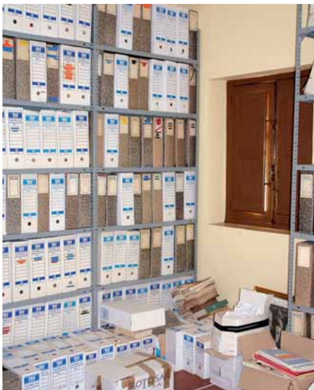
Archivo Municipal de Nuñomoral antes de elaborar el Inventario.