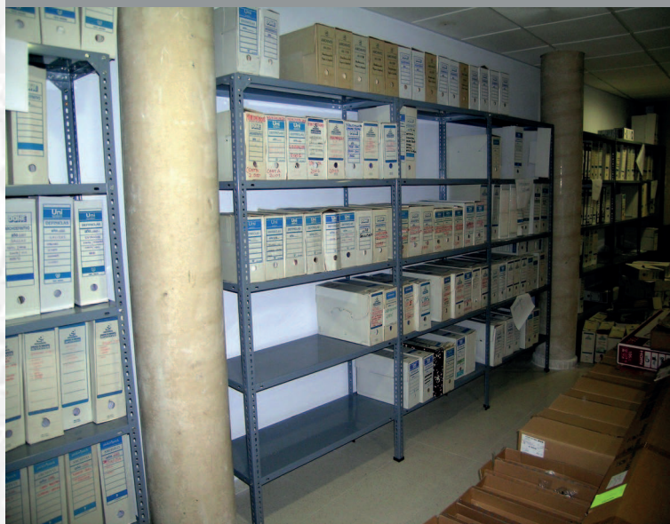
Archivo Municipal de Medellín antes de la elaboración del Inventario.