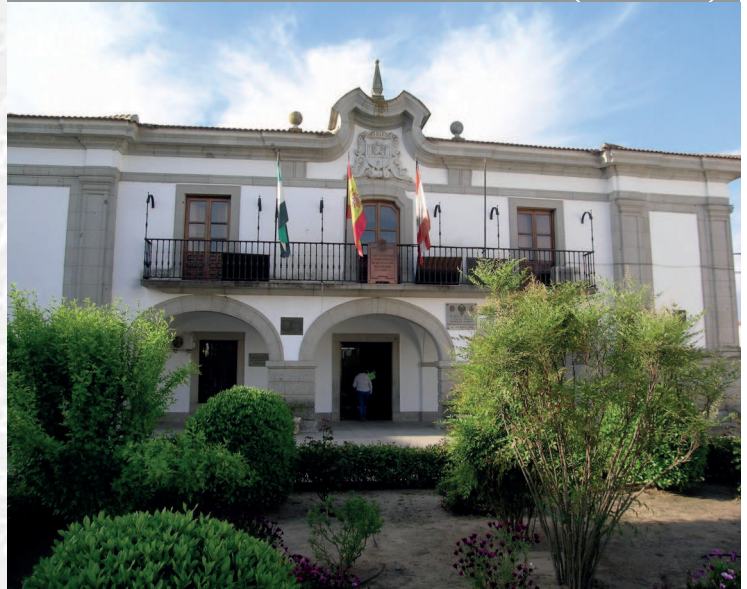
Ayuntamiento de Medellín

STREMADURA Por Lopez año de 1700. y pa Fuera, por el ucia, y por el Occidente con alien- incia del Reyno de Portugal. nte a sus 52. leguas, y Norte por lo mas ancho tertilidad esta Pro- Rios Tago, y Guadiana, viesan por en medio, y chicas, que son el diaton- y el stradilla & Badajoz la, Capital de la Provin- Obispado, y un Puente sobre diano, edificado por los llaza de Guerra, y tiene Castillos, el uno del regal, y del otro lado erro esta el fuerte de S. Merida, y en esta Angu- nto tiempo libre de la antigua situada sobre el Rio Guadiana.