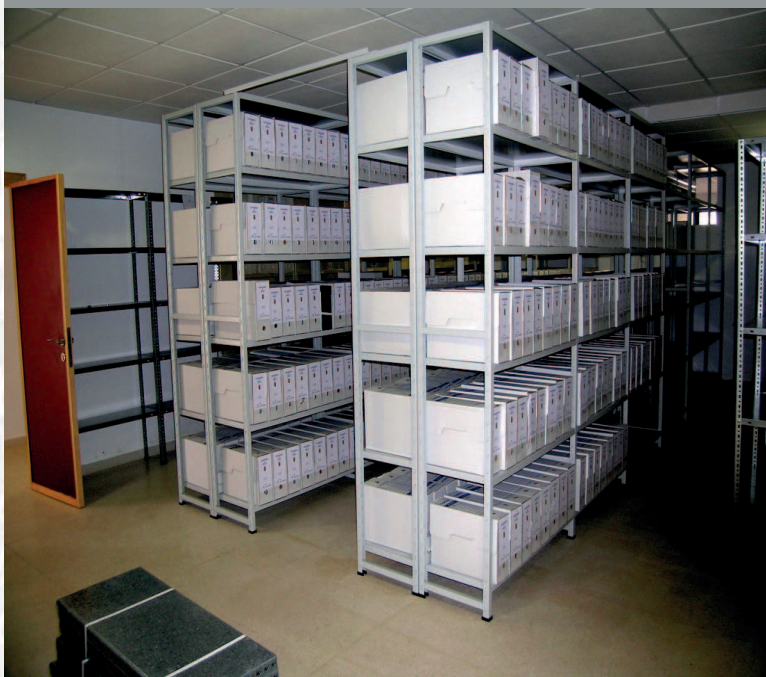
Archivo Municipal de Medellín después de la elaboración del inventario.