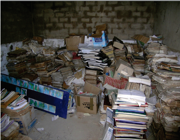
Archivo Municipal de La Parra antes de la elaboración del Inventario.

ESTREMADURA Por Lopez año de 1700. Fuera, por el ucia, y por el Occidente con Allen- ncia del Reyrio de Portugal. nte á sus, b2. leguas, y Norte por lo mas ancho tertila en esta Pro- Rios Tago, y Guadiana, viesan por enmedio, y chicas, que son el di non- y el stradilla & Badajoz lia, Capital de la Provin- Obispado, y en Puente sobre dima, edificada por los llaza de guerra, y tiene Castillos, el uno del regal, y del otro lado erro es la el fuerte de S. Merida, llamada Angu- bro tiempo libeza de la antigua situada sobre el Rio Guadiana.