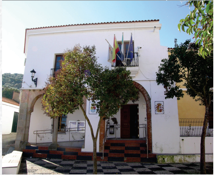
Ayuntamiento de La Parra

ESTREMADURA Por Lopez año de 1700. y pa Fuera, por el ucia, y por el Occidente incia del Reyno de Portugal nte a sus 62. leguas, y Norte por lo mas ancho tertilidad en esta Pro- Rios Tago, y Guadiana, viesan por en medio, y chicas, que son el di non y el stradilla & Badajoz la, Capital de la Provin- Obispado, y en Puente sobre dima, edificada por los llaza de guerra, y tiene Castillos, el uno del regal, y del otro lado erro esta el fuerte de S. Merida, llamada Angu- bro tiempo libeza de la antigua situada sobre el Rio Guadiana.