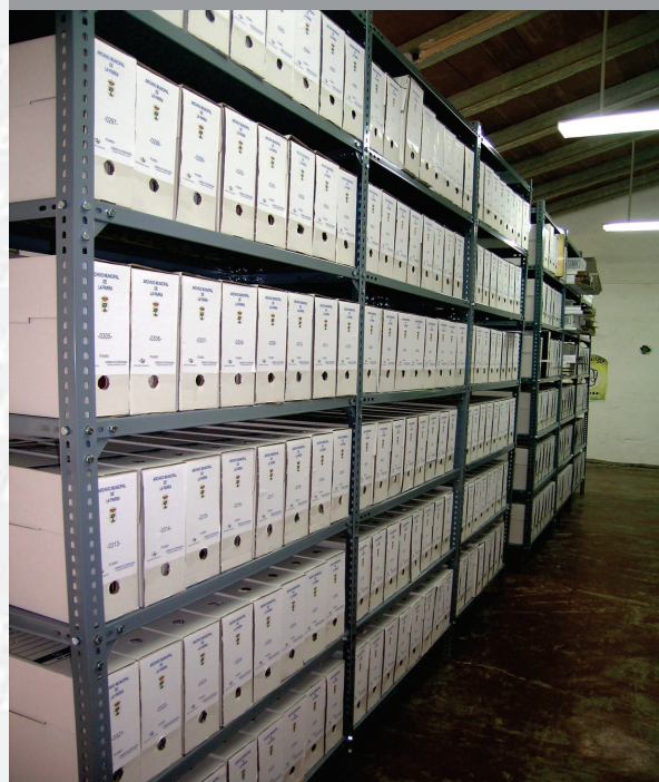
Archivo Municipal de La Parra después de la elaboración del inventario.