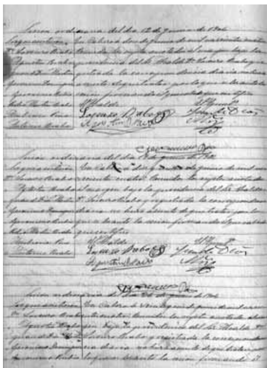
Acta de sesión, 1904.