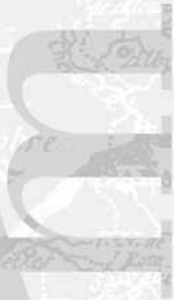
Detalle del Acta de sesión, 1927.