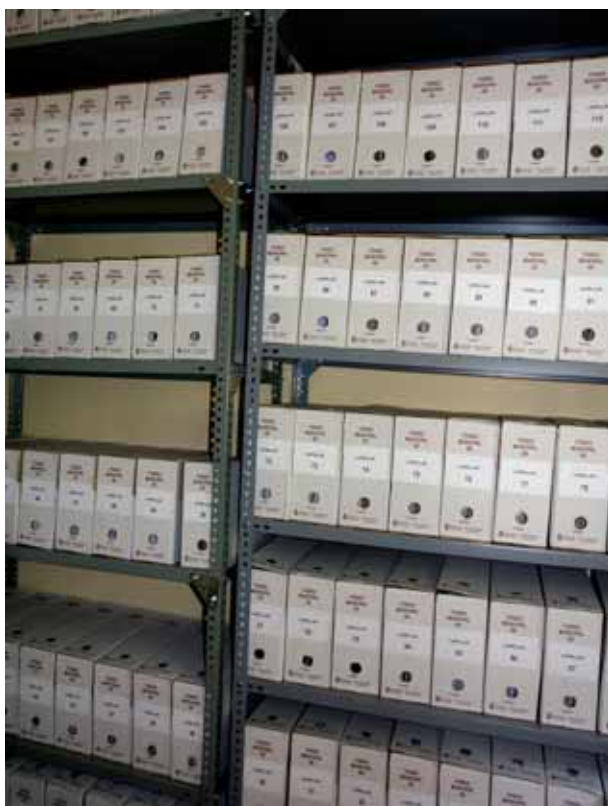
Archivo Municipal de Ladrillar después de la elaboración del Inventario.