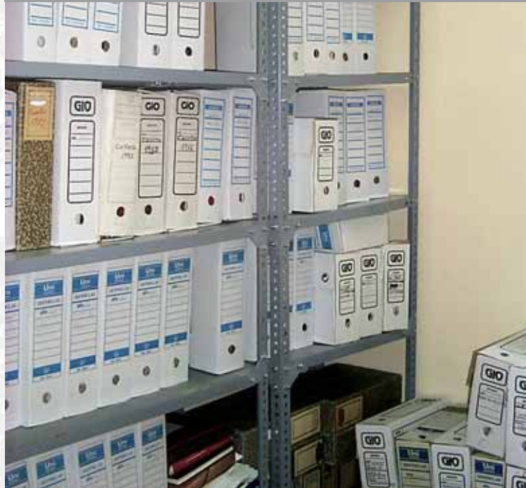
Archivo Municipal de Ladrillar antes de elaborar el Inventario.