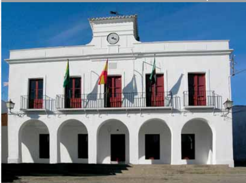
Fachada del Ayuntamiento.