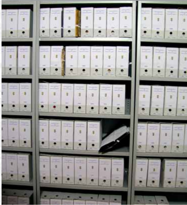
Archivo Municipal de Higuera de Llerena después de elaborar el Inventario.

Vieja, por lucia, y por el Occide incia del Reyno de Po orte a Sur, 52. aguas Oeste por lo mas aucl entida en esta Pro - Rios Top, y Guadiana viesan por en medio chicos, que son el demon y el stradilla & Badajoz La, Capital de la Proven Obispado, y un Puente sobre diana, edificado por los Ala de Guerra, y tiene Castillos, el uno del O riginal, y del otro lado erro esta el fuerte de S. Merida, famosa Augu nto tiempo habia de la antigua situada sobre el Rio Guadiana.