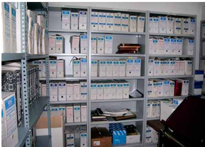
Archivo Municipal de Higuera de Llerena antes de la elaboración del Inventario.