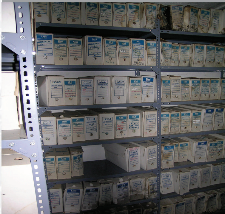
Archivo Municipal de Herrera del Duque antes de la elaboración del inventario.

STREMADURA Por Lopez año de 1700. Fueja, por el ucia, y por el Occidente incia del Reyno de Portu nte a sus 62. leguas y Norte por lo mas ancho tertila en esta Pro- Rios Tago, y Guadiana, viesan por en medio, y chicas, que son el di non y el straitta & Badajoz lia, Capital de la Provin- Obispado, y en Puente sobre dima, edificada por los llaza de guerra y tiene Castillos, el uno del regal, y del otro lado erro es la el fuerte de S. Merida Lanerata Angu- bro tiempo libeza de la antigua situada en el Rio Guadiana.