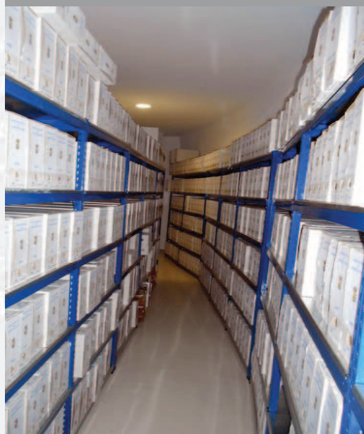
Archivo Municipal de Herrera del Duque después de la elaboración del Inventario.