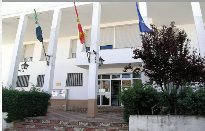
Ayuntamiento de Herrera del Duque