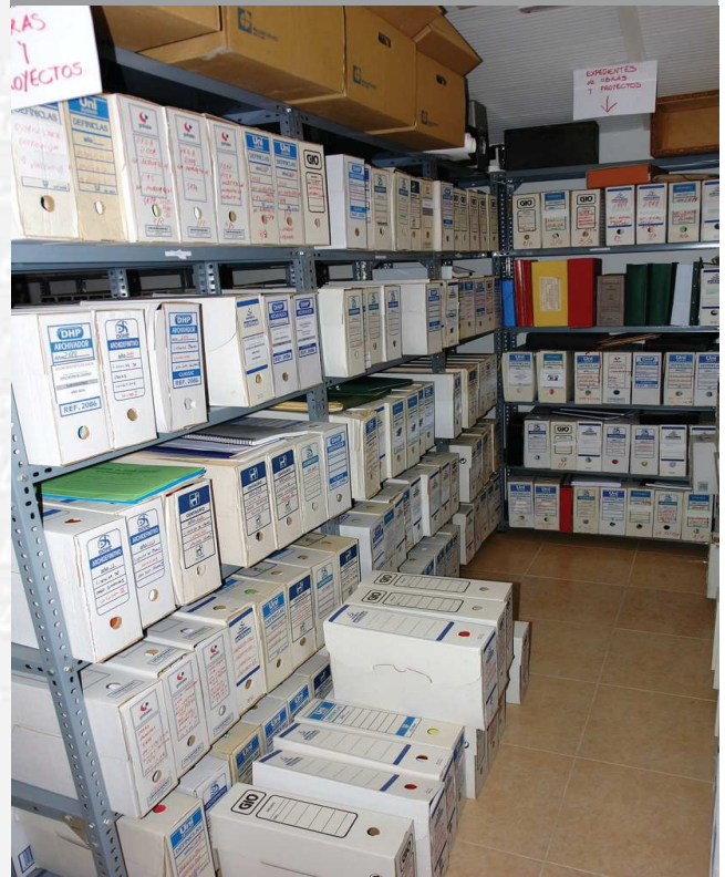
Archivo Municipal de Gata antes de la elaboración del Inventario.