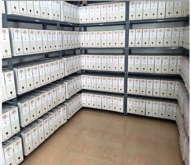
Archivo Municipal de Gata después de la elaboración del inventario.