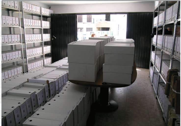
Archivo Municipal de Fuenlabrada de los Montes, después de la elaboración del Inventario.