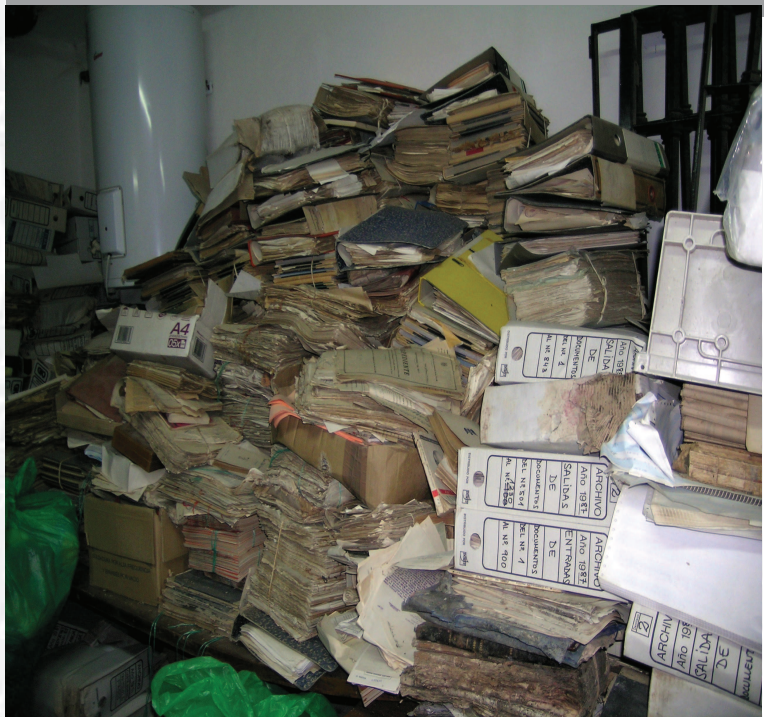
Archivo Municipal de Fuenlabrada de los Montes antes de la elaboración del Inventario.