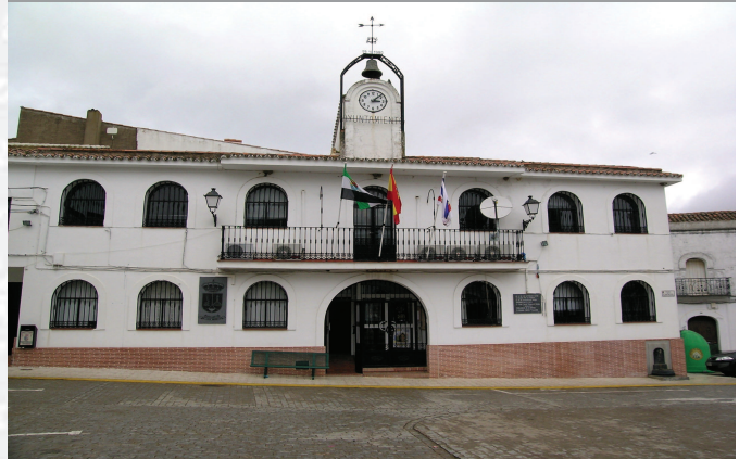
Ayuntamiento de Fuenlabrada de los Montes