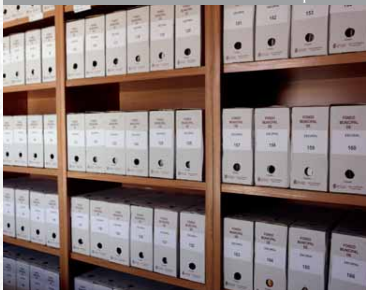
Archivo Municipal de Escorial después de la elaboración del Inventario.