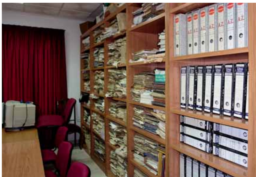
Archivo Municipal de Escorial antes de elaborar el Inventario