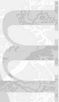
Libro Privilegio de la Villa de Escorial, 1678.