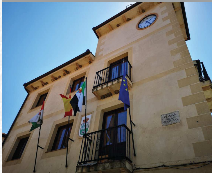
Ayuntamiento de Eljas

STREMADURA Por Lopez año de 1700. Fuera, por el ucia, y por el Occidente con sien- ncia del Reyno de Portugal. nte a sus 62. leguas, y Norte por lo mas ancho tertilidad esta Pro- Rios Tago, y Guadiana, viesan por enmedio, y chicos, que son el diuon- y el stradilla & Badajoz lia, Capital de la Provin- Obispado, y un Puente sobre diano, edificado por los llaza de Guerra, y tiene Castillos, el uno del reynal, y del otro lado erro esta el fuerte de S. Merida, y merita Angu- bro tiempo libre de la antigua situada sobre el Rio Guadiana.