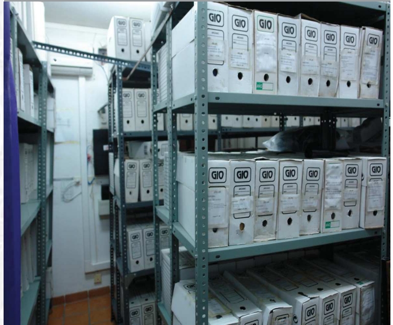
Archivo Municipal de Eljas antes de la elaboración del Inventario.

STREMADURA Por Lopez año de 1700. Fuera, por el ucia, y por el Occident ncia del Reyno de Portugal. nte á sus, 52. leguas, y Norte por lo mas ancho tertilidad en esta Pro- Rios Tago, y Guadiana, viesan por enmedio, y chicos, que son el diuon- y el stradilla & Badajoz lia, Capital de la Provin- Obispado, y un Puente sobre diano, edificado por los llaza de Guerra, y tiene Castillos, el uno del reynal, y del otro lado erro esta el fuerte de S. Merida, y merita Angu- bro tiempo libre de la antigua situada sobre el Rio Guadiana.