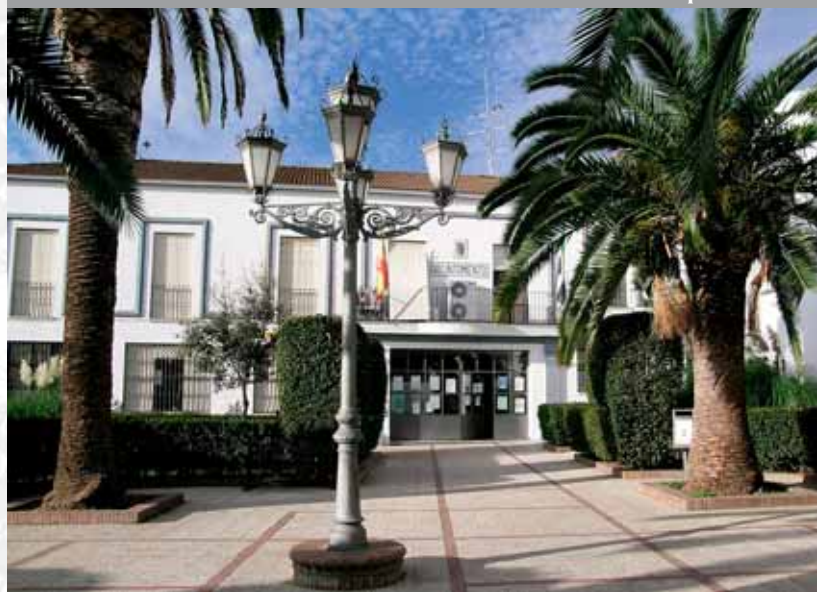
Fachada del Ayuntamiento.

STREMADUR Por Lopez año de 1706. Vaya lucia, y por el O incia del Reyro arte a Sur 52, y Oeste por lo mas ancho entida en esta Pro- rios Top, y Guadiana, viesan por en medio y chicos, que son el demon y el stradilla & Badajoz Sa, Capital de la Proven Obispado, y un Puente sobre diana, edificado por los Ala de Guerra y tiene Castillos, el uno del O rugal, y del otro lado erro esta el fuerte de S. Merida, y en esta Angu- nto tiempo habia de la antigua situada sobre el Rio Guadiana.