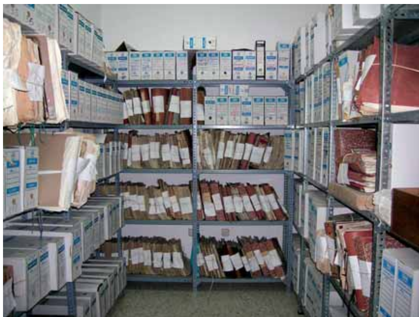
Archivo Municipal de Berlanga antes de la elaboración del Inventario.