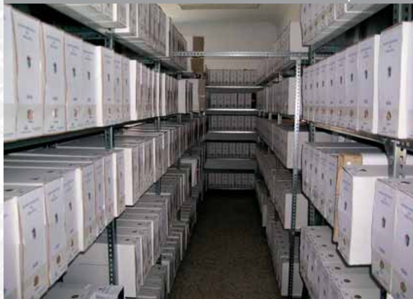
Archivo Municipal de Berlanga después de elaborar el Inventario.