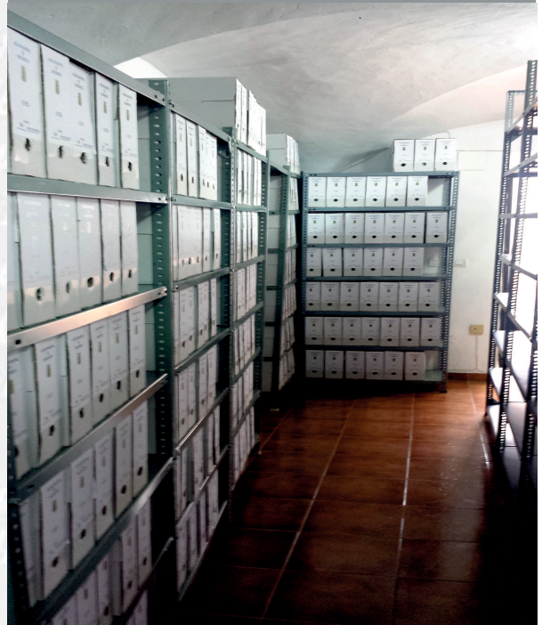
Archivo Municipal de Barcarrota después de la elaboración del inventario.