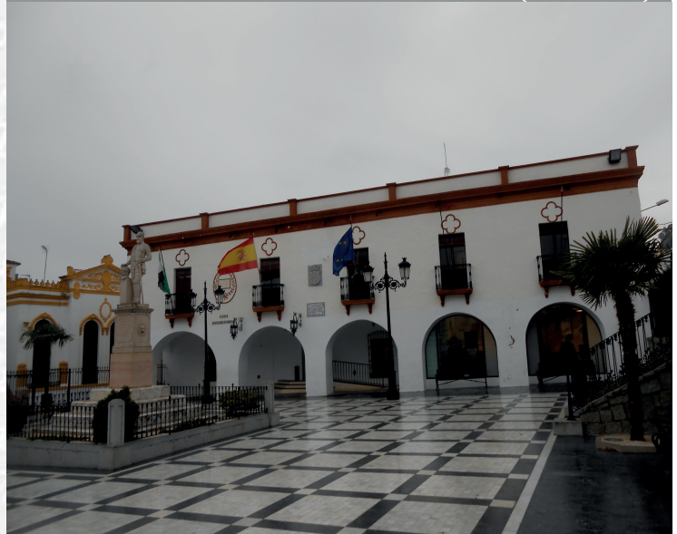
Ayuntamiento de Barcarrota

STREMADURA Por Lopez año de 1700. Fue, por el ucia, y por el Occidente con alien- incia del Rey de Portugal. ante a sus 62. leguas, y Norte por lo mas ancho tertilis en esta Pro- Rios Tago, y Guadiana, viesan por en medio, y chicas, que son el di non y el stradilla & Badajoz la, Capital de la Provin- Obispado, y un Puente sobre diano, edificado por los llaza de Guerra, y tiene Castillos, el uno del regal, y del otro lado erro esta el fuerte de S. Merida, y en esta Angu- nto tiempo libre de la antigua situada sobre el Rio Guadiana.