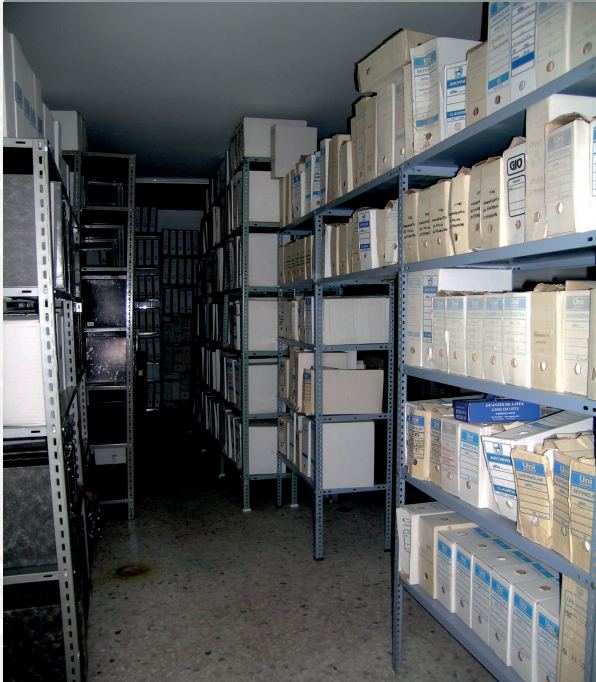
Archivo Municipal de Barcarrota antes de la elaboración del inventario.

STREMADURA Por Lopez año de 1700. ... Betonia, p ... Españole ... Tiene su ... por el ... el Reyno ... por el ... Castilla ... y parte de ... Fuen, por el Medio- ... ucia, y por el Occidente con el ... ncia del Reyno de Portugal. ... rnte a sus 52 leguas, y ... Norte por lo mas ancho ... fertilisima esta Pro- ... Rios Tago, y Guadiana, ... rtesan por en medio, y ... rchicas, que son el diomon- ... y el stradilla & Badajoz ... la, Capital de la Provin- ... Obispado, y un Puente sobre ... dioma, edificado por los ... Plaza de Guerra, y tiene ... Castillos, el uno del ... rnegal, y del otro lado ... rro esta el fuerte de S. ... Merida, y en esta Angu- ... nro tiempo libreza de la antigua ... situa la sobre el Rio Guadiana.