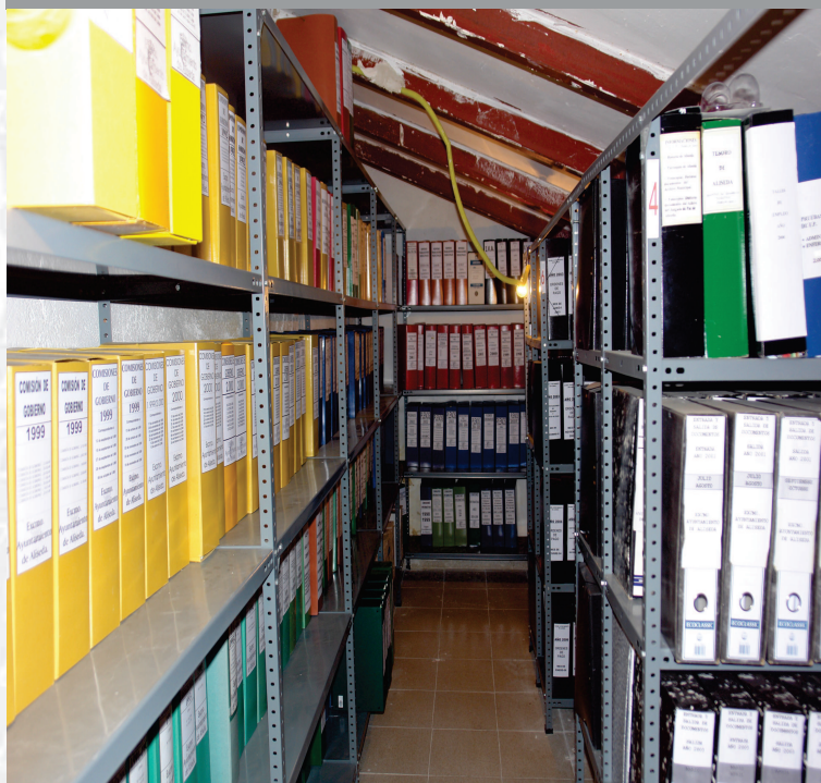
Archivo Municipal de Aliseda antes de la elaboración del Inventario.